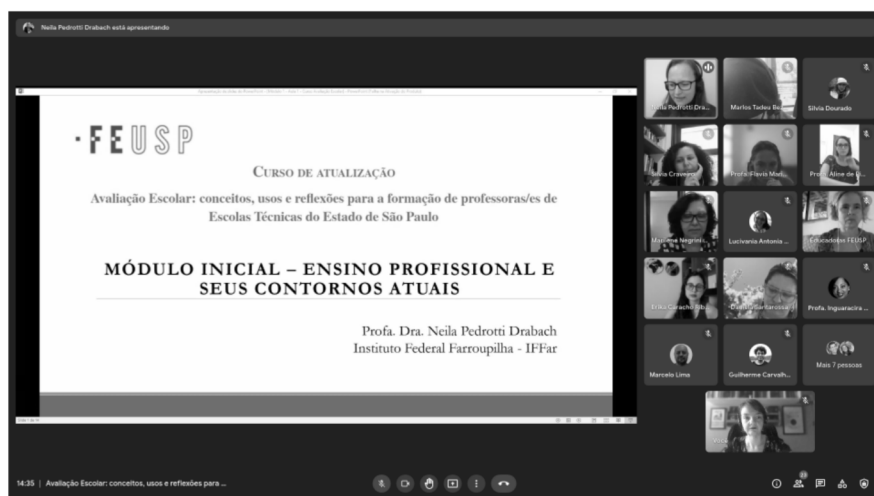
Imagem: aula do primeiro módulo - 10/09/2021