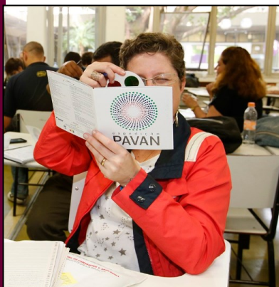
Curso de óptica - Encontro USP Escola

Estão abertas, até o dia 11 de maio, as inscrições para a 24ª edição do Encontro USP Escola , evento que tem como objetivo central promover formação continuada para professoras/es da educação básica em todas as áreas do conhecimento.