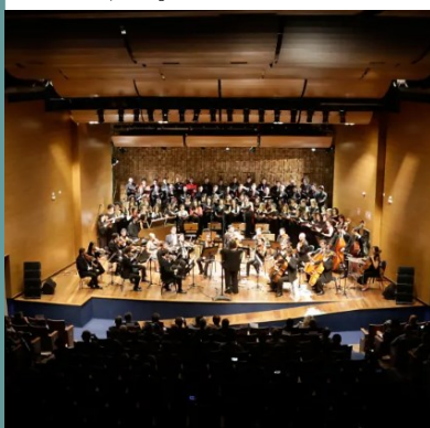
OSUSP e CORALUSP no Anfiteatro Camargo Guarnieri.

Mais informações: https://bit.ly/3SRRNOU