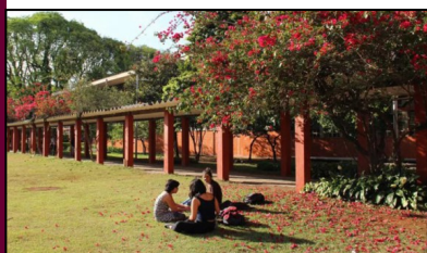
Gramado em frente ao Bloco A da FEUSP.