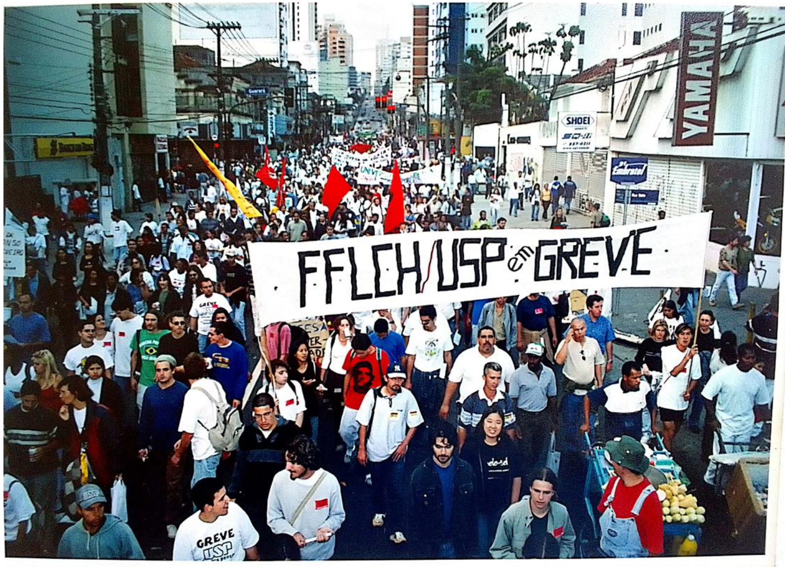
Uma greve de muitas passeatas por avenidas e ruas de São Paulo...