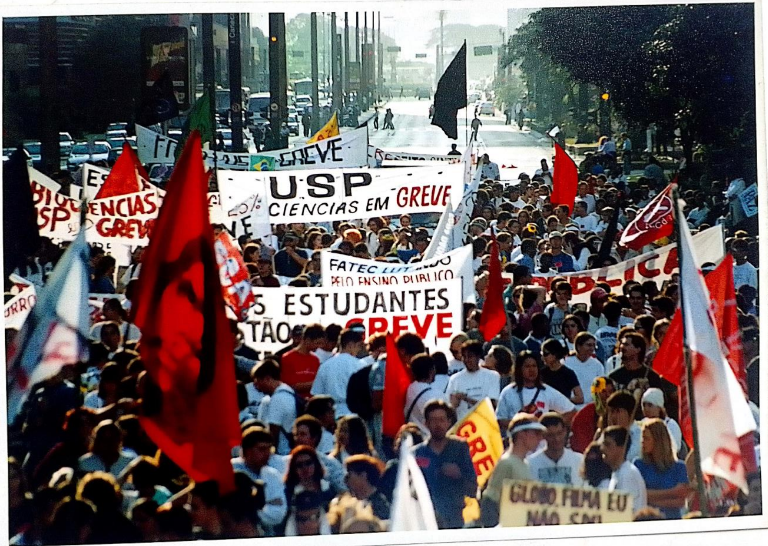
De manifestações na tradicional Avenida Paulista...