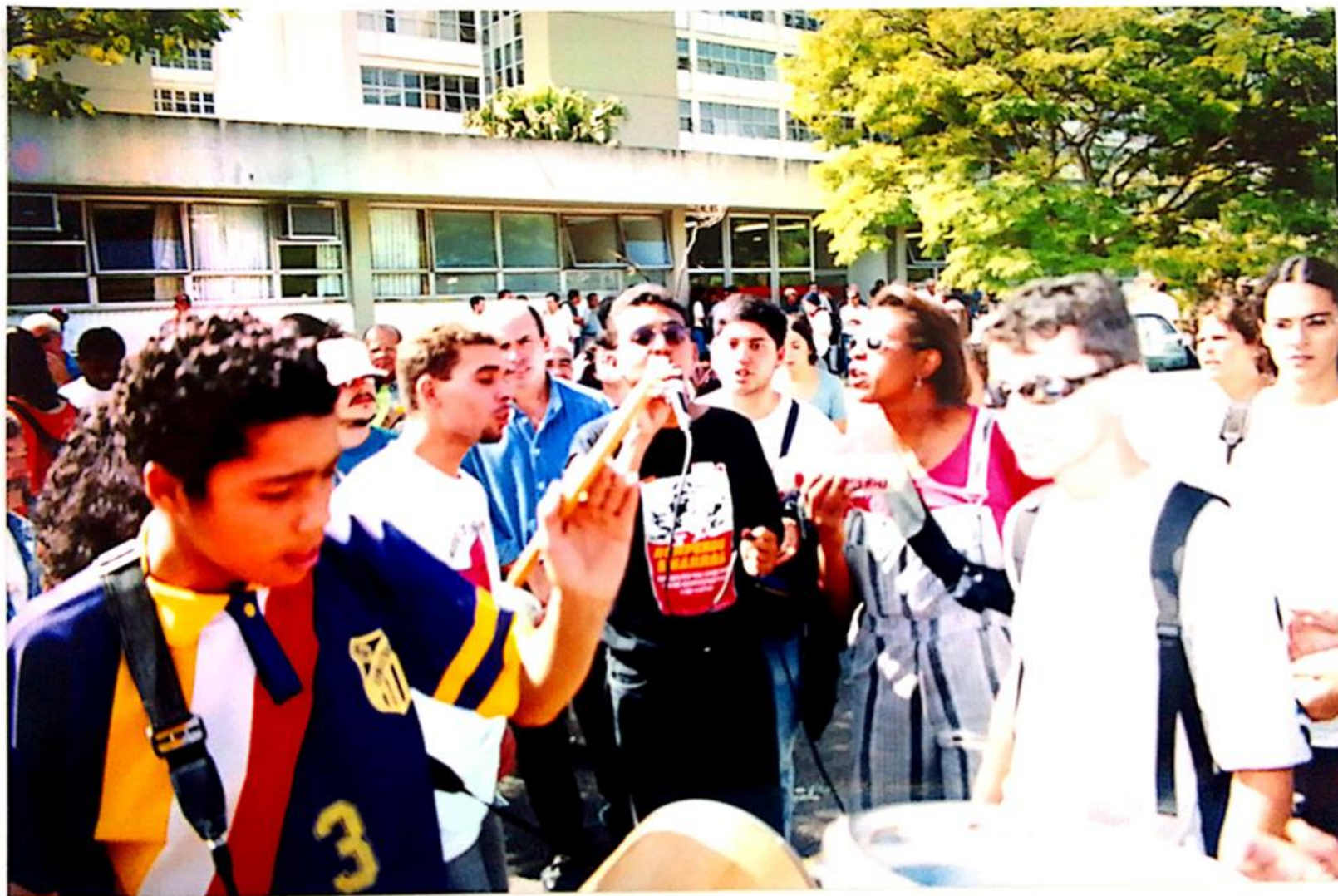
5 de maio - Ato público em frente à Reitoria da USP.