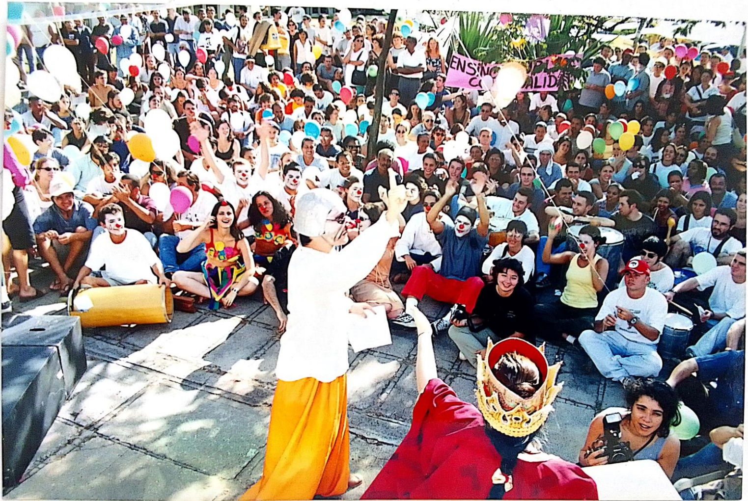
A greve das manifestações artísticas nas praças e avenidas..