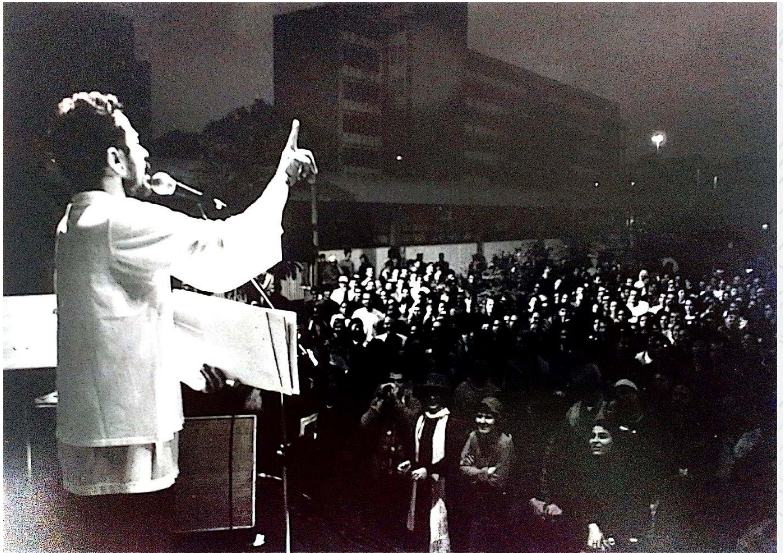
Show de Tom Zé em apoio a Greve da USP (2000).