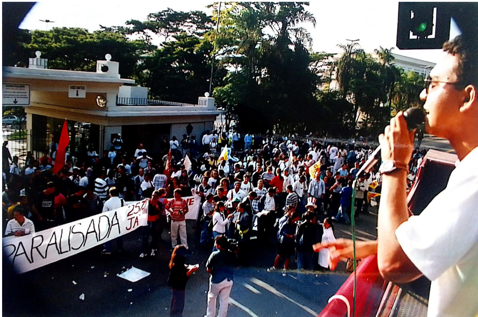
Grande manifestação em frente ao Palácio dos Bandeirantes...